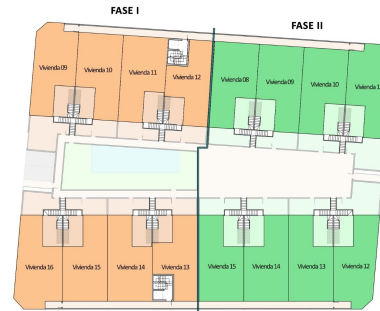
ISO A3 - Escala 1:250