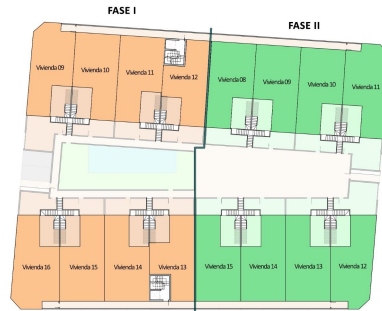
ISO A3 - Escala 1:250